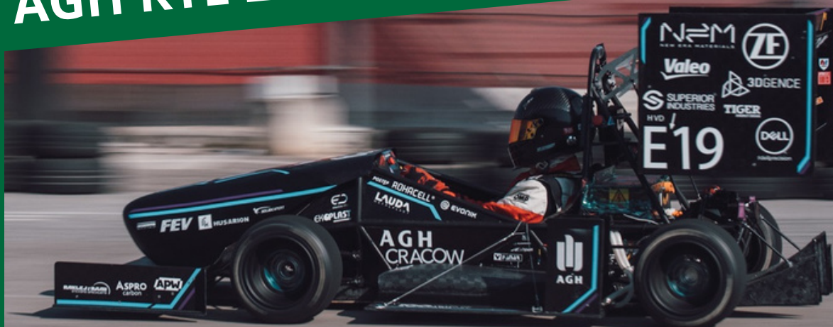
AGH RTE 2.0 "Lem"

Warto również zaznaczyć, że od ponad dwóch lat pracujemy nad systemem autonomicznym który zostanie zaimplementowany do bolidu elektrycznego w ciągu najbliższych miesięcy.